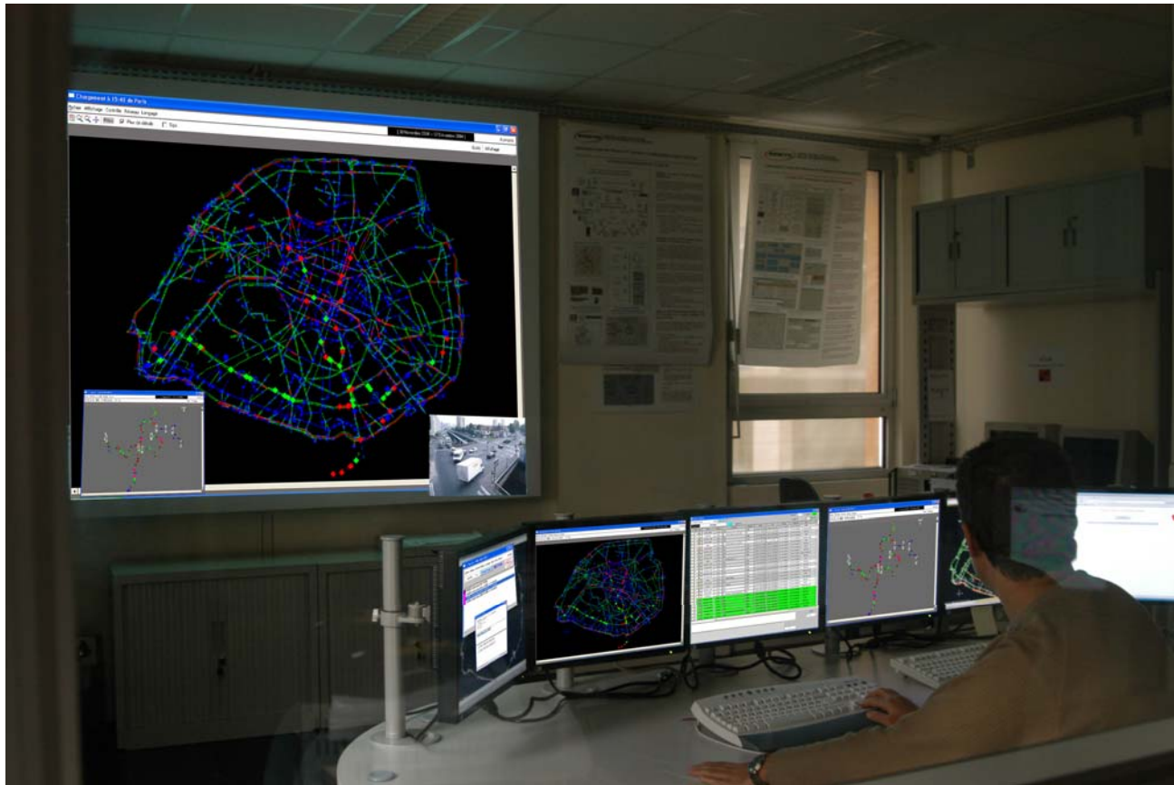
Présentation Predim Radio France