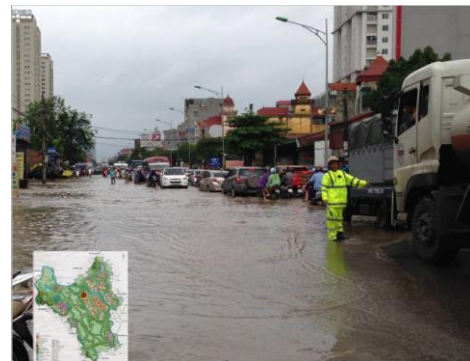
Figure 2 Situation de la planification inappropriée des routes du Vietnam